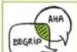
BOUWSTEEN 3: EFFECTIEVE COMMUNICATIE

We gaan op zoek naar aangeleerde patronen in gedrag, gedachten en emoties. Vervolgens kijken we hoe je zou willen dat je kind jou ziet? Welk voorbeeld wil jij zijn?