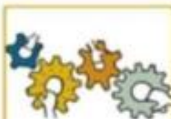
BOUWSTEEN 1: ROLLEN EN VERANTWOORDELIJKHEDEN