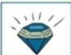
BOUWSTEEN 4: WAARDEN, NORMEN EN REGELS

Omdat de band tussen kinderen en ouders zo belangrijk is gaan we aan de slag met communicatieve vaardigheden.