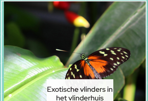
Exotische vlinders in het vlinderhuis