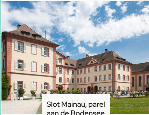
Slot Mainau, parel aan de Bodensee