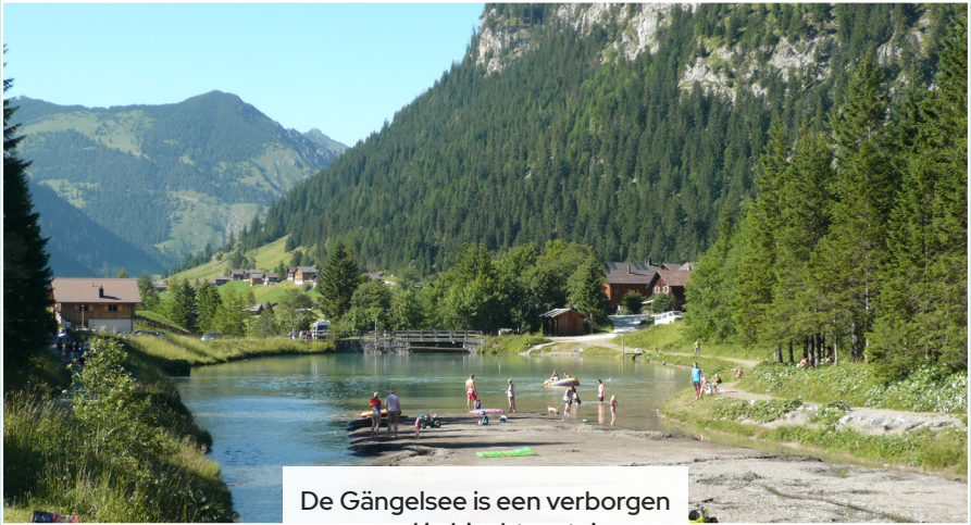
De Gängelsee is een verborgen parel in Liechtenstein