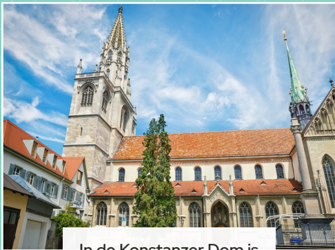
In de Konstanzse Dom is Hus veroordeeld