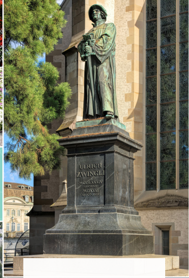
Standbeeld van Zwingli in Zürich