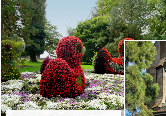
Kleurenpracht op bloemeneiland Mainau