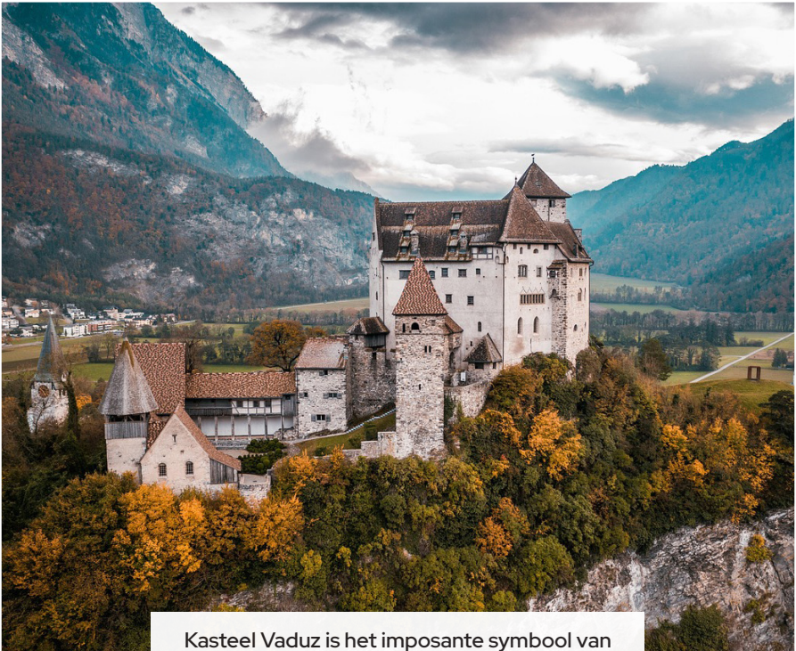
Kasteel Vaduz is het imposante symbool van Liechtenstein