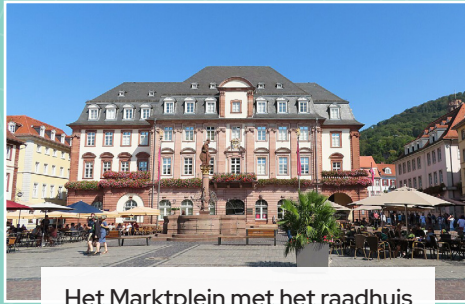
Het Marktplein met het raadhuis