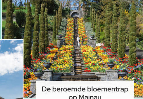
De beroemde bloementrap op Mainau