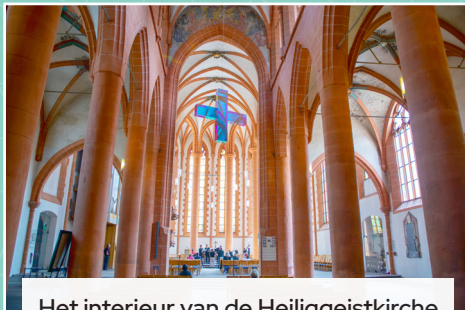
Het interieur van de Heiliggeistkirche