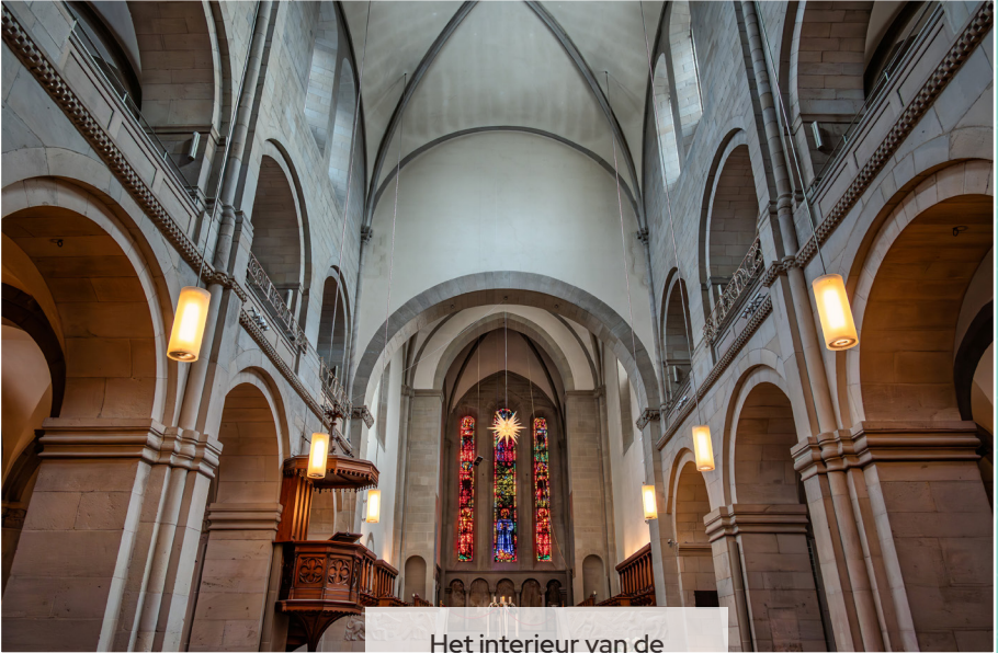
Het interieur van de Grossmünster