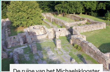
De ruïne van het Michaelsklooster