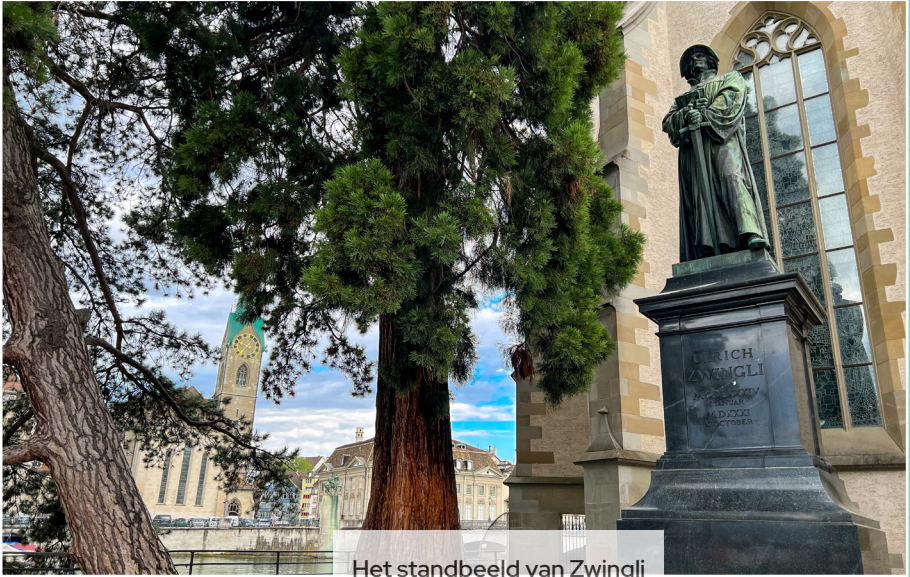
Het standbeeld van Zwingli