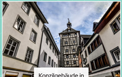
Konzilgebäude in Konstanz