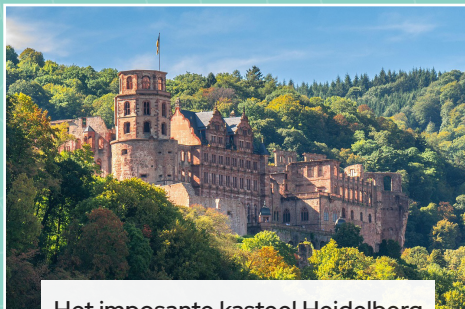
Het imposante kasteel Heidelberg