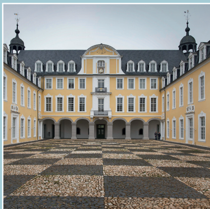
Het buitenaanzicht van Slot Oranienstein