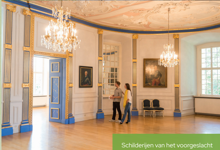
Schilderijen van het voorgeslacht van de Oranje-Nassaus in Slot Oranienstein