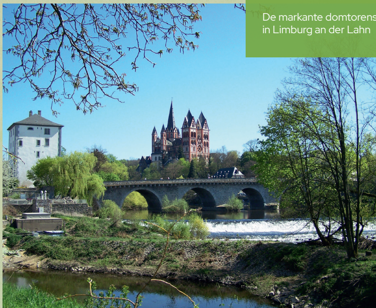
De markante domtorens in Limburg an der Lahn