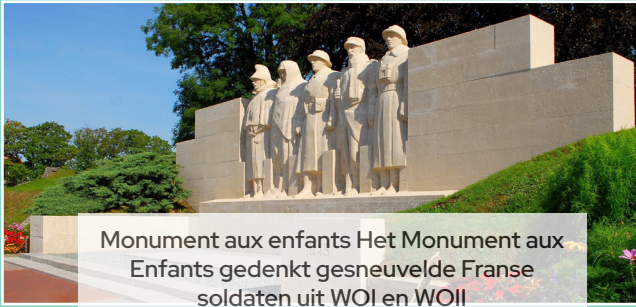
Monument aux enfants Het Monument aux Enfants gedenkt gesneuvelde Franse soldaten uit WOI en WOII