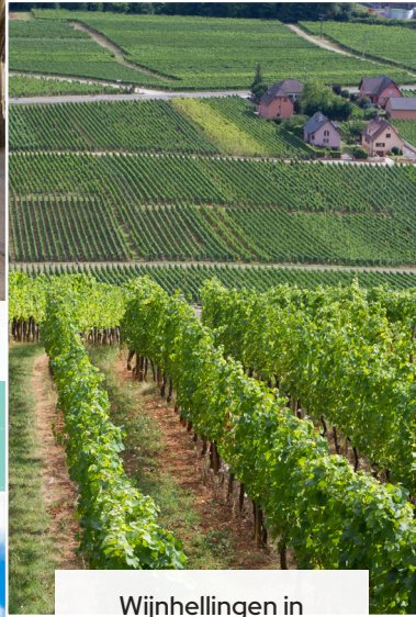
Wijnhellingen in Lotharingen