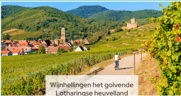
Wijnhellingen het golvende Lotharingse heuvelland