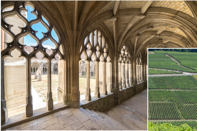
De kloostergang in de Notre-Dame in Verdun