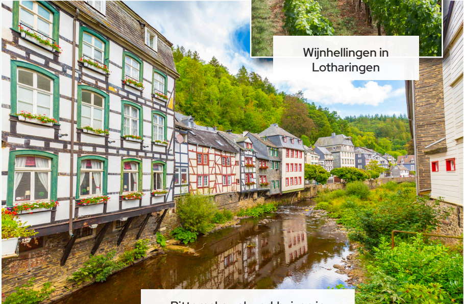
Pittoreske vakwerkhuzen in Monschau