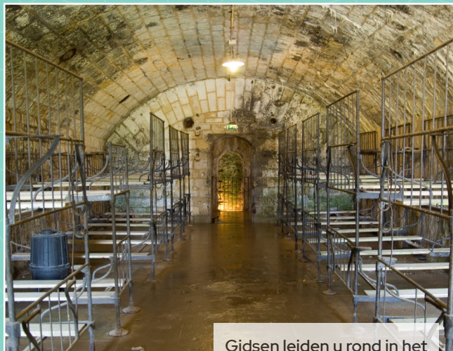
Gidsen leiden u rond in het Fort van Douaumont