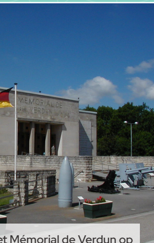
het Mémorial de Verdun op het voormalige slagveld

's Middags bezoekt u het Ossuarium van Douaumont (beenderhuis) op eigen gelegenheid. Het is een groot herdenkingsmonument. U kunt een film bekijken waarin u in het Nederlands informatie krijgt over de locatie en de historie. Hier liggen de resten van circa 130.000 ongeïdentificeerde Franse en Duitse soldaten uit de Slag om Verdun. Het gebouw is ongeveer 137 meter lang en is ontworpen als een soort in de grond gestoken zwaard, waarbij de centrale toren de greep vormt. Direct vóór het ossuarium ligt de nationale militaire begraafplaats van Fransen die hier sneuvelden.