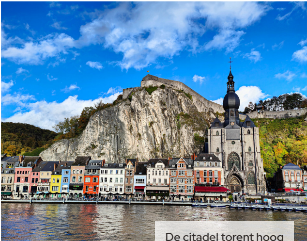
De citadel torent hoog boven Dinant uit

Woensdagmorgen bezoeken we het Mémorial de Verdun, een modern museum en gedenkplaats op het voormalige slagveld. Dit museum is volledig gewijd aan