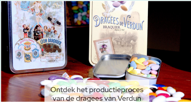
Ontdek het productieproces van de dragees van Verdun