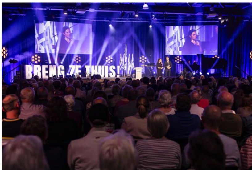
Foto CVI: 7 oktober 2025 – 7 oktober herdenking 'Brenge ze thuis'