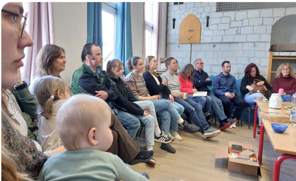
MV meeting, zendelingen uit de regio komen samen om te delen en te bidden

Daarnaast hebben we natuurlijk ook spelletjes gespeeld, lekker gekookt en gegeten en met elkaar gelachen en gehuild. Heel waardevol om zo met elkaar op te trekken.