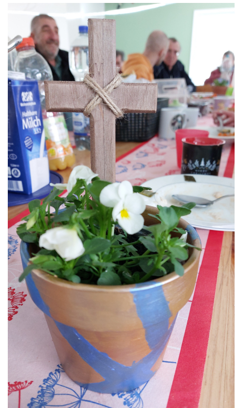
Pasen in het Gewächshaus

Volg ook de ECM WEBLOG en scan deze code