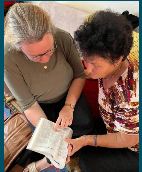
Bezoek afsluiten met een open Bijbel