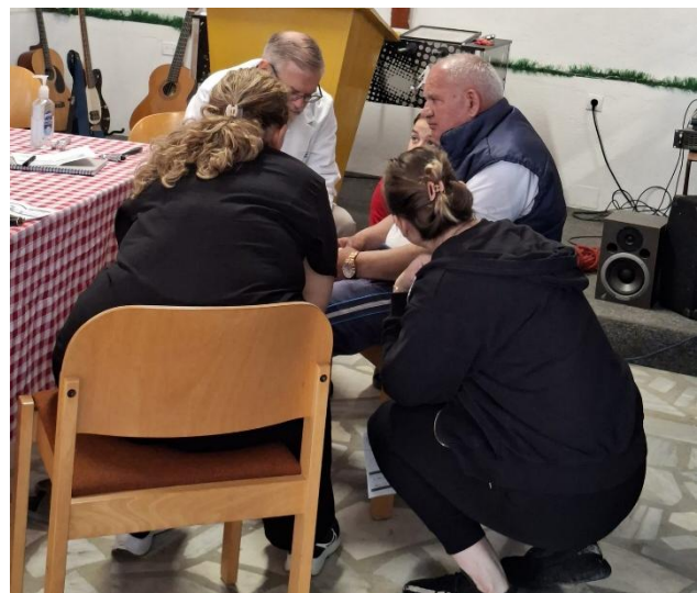
Medische outreach in de kerk van Laç

Waarom ik dit schrijf? Ik deel het met je omdat ik in al die vervelende momenten steeds weer mag opmerken dat er 'engelen' op mijn weg geplaatst worden: een vriendin die de tijd nam om mee te gaan en even met de vuist op tafel sloeg. Of die keer dat ik bij één van de bezoeken geholpen werd door een Albanees die Nederlands spreekt (hij spelt elke dag 'papegaai' om zijn Nederlands niet te verliezen, haha) en mij een stapje verder hielp. Of een chagrijnige ambtenaar bij de migratiepolitie die mompelt hij het wel even zal regelen en ervoor zorgt dat vrij rap de aanvraag van de nieuwe verblijfsvergunning was goedgekeurd. En natuurlijk niet te vergeten de kerk in Lushnjë die een fijne woonplek heeft gevonden voor mij. Al die 'engelen' zijn steeds weer het bewijs dat God doorgaat in het voorzien in van dat wat nodig is.