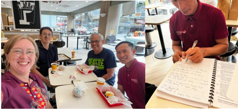
Coaching en ontbijten, elke morgen voor de training.

Dus hoewel dit officieel een trainingsweek was voor facilitators in preektrainingen op de eilanden Leyte en Samar, werd het veel meer dan dat. In gesprekken, tijdens maaltijden en in gedeelde ervaringen werden bruggen geslagen tussen generaties—en dat is misschien wel net zo waardevol, zo niet meer als de training zelf.