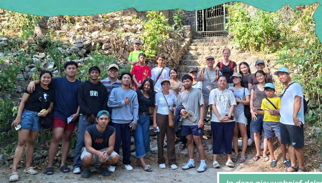
De jongeren (jeugdleiders) van Tanay en Padila

Nieuwsbrief familie Jansen nr. 15- juni 2026