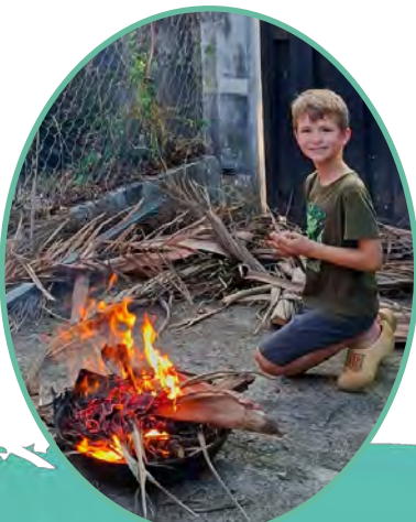
Vuurtje stoken in de tuin

Mijn lievelingsdieren zijn natuurlijk onze honden: Banny en Tanya!