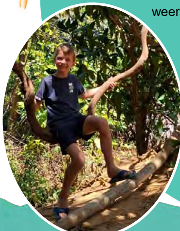
Schommelen op een liaan