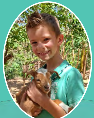
Een geitje uit het bamboedorp