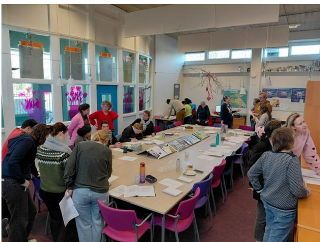
Figuur 1 Met het team aan de slag met de nieuwe doelen voor taal.

Daarnaast worden boeken nog meer ingezet in de verschillende lessen. Boeken lezen is dus niet meer alleen voor het leesplezier, maar boeken krijgen ook een inhoudelijke functie. Verhalen helpen leerlingen om zichzelf, anderen en de wereld te begrijpen. We hebben als team gekeken naar wat we nu al doen en wat nog beter kan. Gelukkig konden we concluderen dat we al veel doen van wat er in de kerndoelen beschreven staat. Met de verbeterpunten gaan we de komende periode aan de slag.