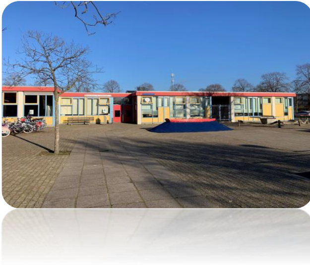
Locatie Midden, Amsterdamweg