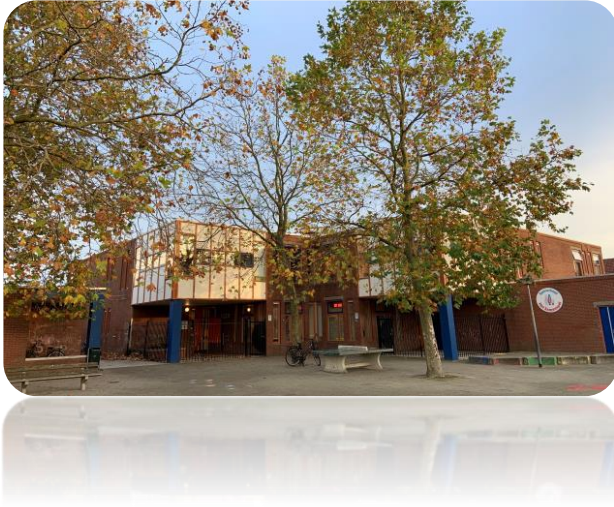
Locatie Noord, Leeuwardenplein