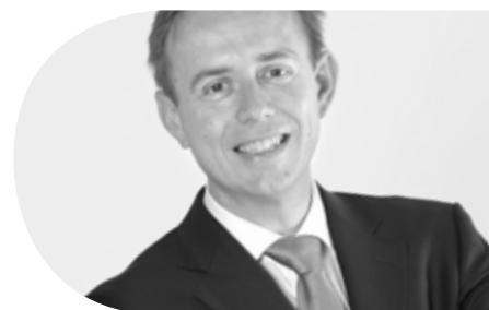
KEES VAN DER STAIJ, FRACTIEVOORZITTER SGP TWEDE KAMER