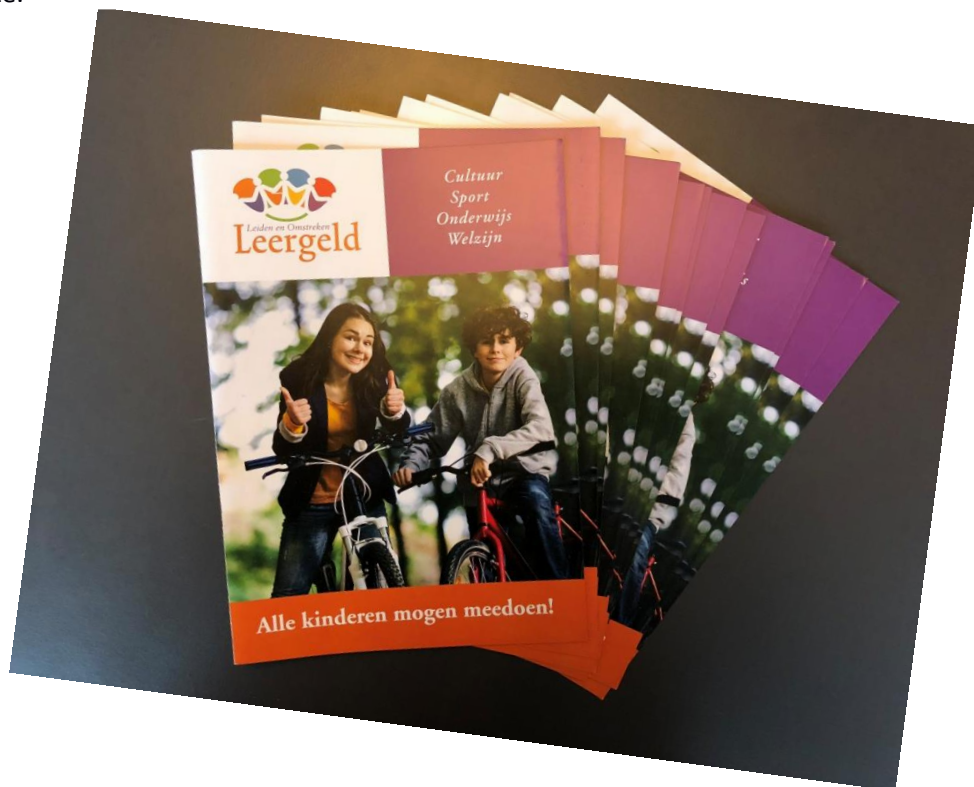
Foto: de nieuwe folder, die eind 2017 gereed kwam