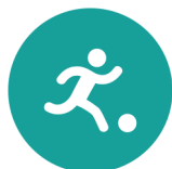
Spel en beweging/ bewegingsonderwijs