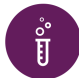
Wetenschap en Technologie