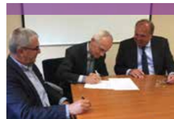
Strategische samenwerkingsovereenkomst met Nationaal Fonds Kinderhulp: fondsenwerving, signalering en agendering en onderlinge doorverwijzingen