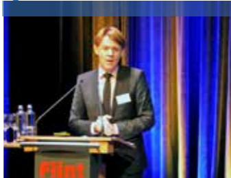
Jubileumviering 20 jaar Stichting Leergeld met o.a. Kim Putters, directeur SCP en Jetta Klijsma, staatssecretaris SZW