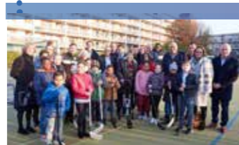
Overkoepelend plan van aanpak: Alle kinderen doen mee: de handen ineen voor meer bereik!

Signalering van hoge onderwijskosten in MBO. RESULTAAT: motie Tweede Kamer voor onderzoek. RESULTAAT: incidentele bijdrage van 5 miljoen euro voor schooljaar 2016/2017 als tegemoetkoming voor ouders van leerplichtige mbo'ers